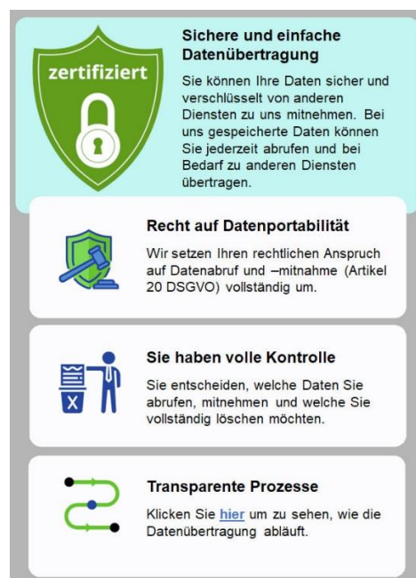
Abbildung 2: In der Studie bewerteter visueller Hinweis auf Möglichkeit zur Datenportabilität

Die Visualisierungen wurden im Rahmen eines Projektseminars entwickelt und initial evaluiert – das Vorgehen wird in Abschnitt 5.1 im Anhang näher beschrieben.